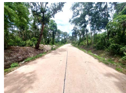
เส้นทางเข้าสู่พื้นที่โครงการ