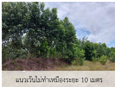
แนวต้นไม้ทำเหมืองระยะ 10 เมตร