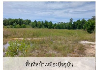
พื้นที่หน้าเหมืองปัจจุบัน