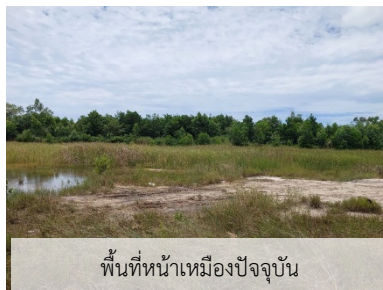
พื้นที่หน้าเหมืองปัจจุบัน