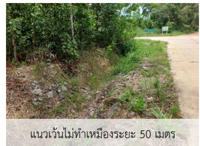
แนวต้นไม้ทำเหมืองระยะ 50 เมตร